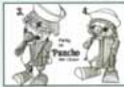
Pancho, der Clown mit BPZ

"Pancho, der Clown" hat dagegen überhaupt kein Zubehör, dafür aber zusätzlich eine weiße Krawatte und einen roten Kragen. Von Elvis sind zwei verschiedene Farben der Mützen bekannt, nämlich braun und grün. Eine Variante kann auch Ringo bieten, in seinem Fundus kann er auf eine grüne oder eine blaue Weste zurückgreifen. Problematisch sind bei allen Figuren die Gesichtseihälften. Erstens lösen sich besonders die beiden Augenaufkleber auf der stark