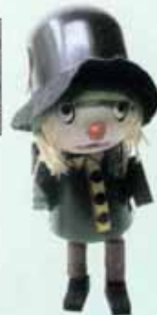
Willi, der Wanderer mit BPZ Vorder- und Rückseite

Im nächsten Heft gibt es dann weitere Kapselfiguren, bis dahin viel Spaß beim Sammeln!