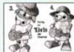
Elvis, der Gitarrist, Elvis Variante und BPZ

gewölbten Kapsel sehr leicht, zweitens reißt die Kapsel selber beim Einstecken auf einen Stift, der die große und die kleine Eihälfte verbindet, in 9 von 10 Fällen ein. Eingerissene Kapseln stellen damit eine deutliche Wertminderung dar, Vorsicht vor nachträglich wieder reparierten Kapseln. Man sollte noch darauf hinweisen, dass Pancho eine kugelförmige Nase besitzt, die Riechorgane der anderen Figuren sind nur halbrund. Auch an der dazugehörigen Kapselöffnung kommt es häufig zu Rissen. Zu jeder Figur gab es einen eigenen BPZ im Querformat, die Aufkleberfolien waren für jede Figur identisch. Eine weitere Serie dieser Machart, die gern mit dem Oberbegriff "Berufe" betitelt wird, besteht aus sechs Figuren, Varianten sind, bei dieser Vielfalt an Teilen