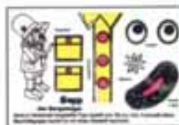
Sepp, der Bergsteiger mit BPZ

beim Kauf achten. Eher seltener fehlt hier seltsamerweise das Zubehörteil, also der Lolli, oder was auch immer das Holzstäbchen mit dem runden Kreis darstellen soll. "Sepp, der Bergsteiger" ist