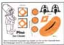
Pino, der Clown mit BPZ

Zu Pino gehören 7 Aufkleber, wobei besonders Mund- und die speziellen Augenaufkleber, die es nur bei dieser Figur in dieser Form gibt, sehr gerne fehlen. Aber auch auf den winzigen Rautenaufklebern auf der gelben Kapsel sollte man