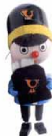
Hans, der Briefträger mit BPZ

überraschend, bislang nicht bekannt. "Hans, der Briefträger" besitzt 8 Aufkleber, davon werden 7 auf der Figur und einer auf der Tasche angebracht. In der Tasche sollten sich 2 rechteckige Briefe befinden, die aus einer Art Löschpapier hergestellt sind.