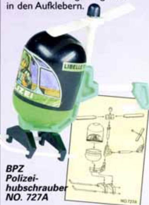
BPZ Polizei- hubschrauber NO. 727A

nur in der Farbgebung und in den Aufklebern.